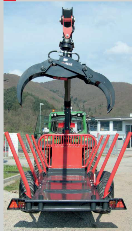
Breite Holzauflage / 1,10 m massives Prallgitter Perfekt für Meterholz